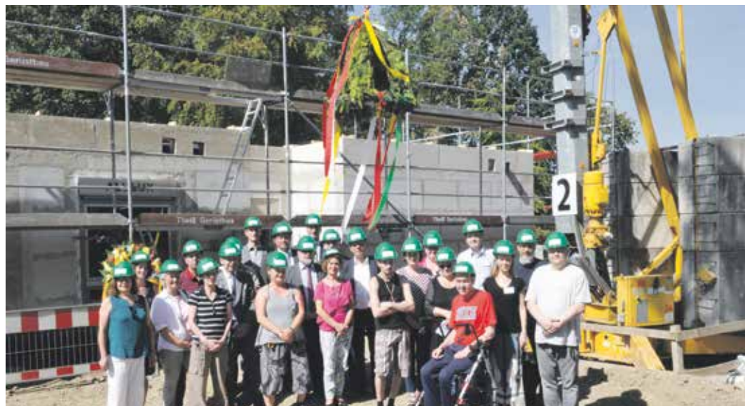
Zukünftige Bewohner, Mitarbeiter, Vorstandsmitglieder der Evangelischen Stiftung Tannenhof, sowie Gäste aus der Politik beim Richtfest zur neuen Wohnstätte.