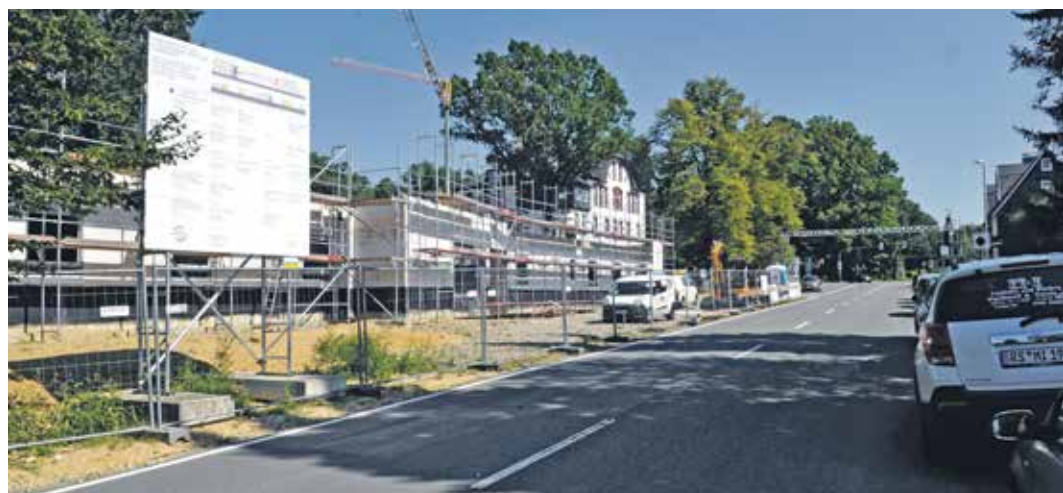
An der Remscheider Straße in Lüttringhausen baut die Stiftung Tannenhof die neue Wohnstätte